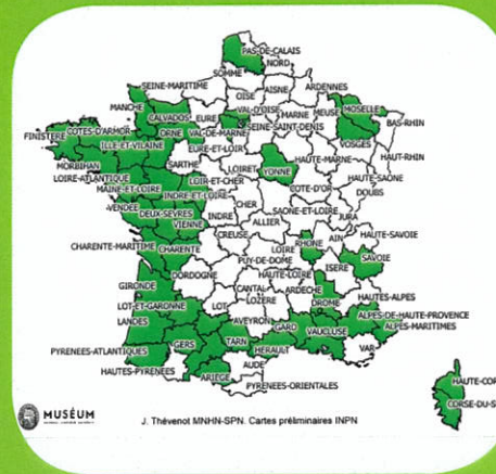
carte de répartition en France © MNHN-INPN – Jessica Thévenot