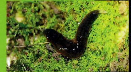
espèce marron plate Obama nungara : source wikimediafoundation.org