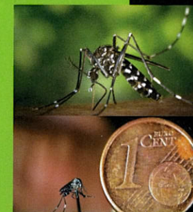
Albopictus en train de piquer Aedes Albopictus et pièce de 1 centime