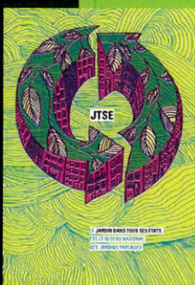
Charte du «jardin dans tous ses états»