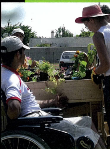
exemple d'un bac adapté