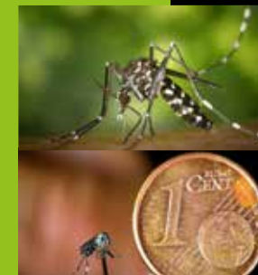
Albopictus en train de piquer : CDC/ James Gathany Aedes Albopictus et pièce de 1 centime : JB Ferré / EID Méditerranée

leur abdomen et leur petite taille. La femelle s'infecte quand elle pique une personne malade. Elle devient alors vectrice et peut transmettre le virus lors d'une nouvelle piqûre. Le moustique « tigre » est fortement affilé à l'homme et il vit au plus près de nous. Il se déplace peu. C'est donc à chacun de nous d'être vigilants pour détruire les larves. La ponte s'effectue sur des « supports » secs, proches de l'eau, indispensables pour le développement des œufs et des larves.