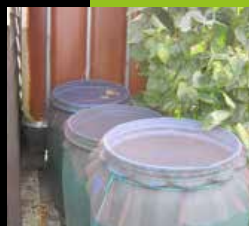
Grille anti-moustiques de maille de 1mm au maximum